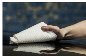
Poly- neat 2P3 220