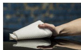
Poly-neat 2P3 220