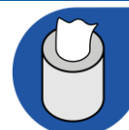
Rouleau à dévidage central